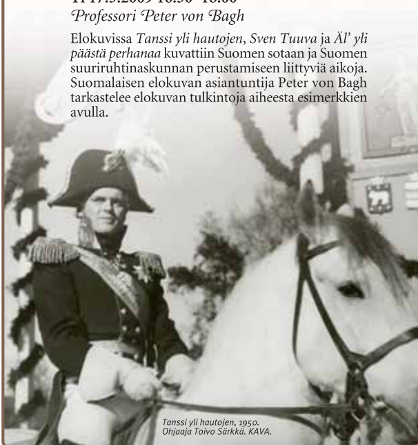
Tanssi yli hautojen, 1950. Ohjaaja Toivo Särkkä.

Elokuviissa Tanssi yli hautojen , Sven Tuuva ja Äl' yli päästä perhanaa kuvattiin Suomen sotaan ja Suomen suuriruhtinaskunnan perustamiseen liittyviä aikoja. Suomalaisen elokuvan asiantuntija Peter von Bagh tarkastelee elokuvan tulkintoja aiheesta esimerkkien avulla.